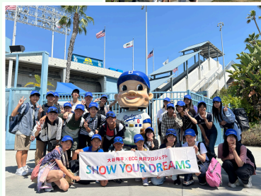
ドジャースタジアム

※試合が延長になった場合でも、22時には球場をみます ※試合中の夕食の提供はございますが、お選びいただけません ※ショッピング時間以外のお土産購入時間はありません