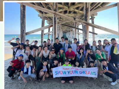
ニューポートビーチ