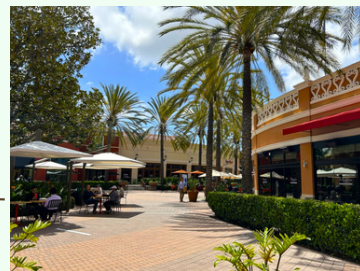
スペクトラム・センター