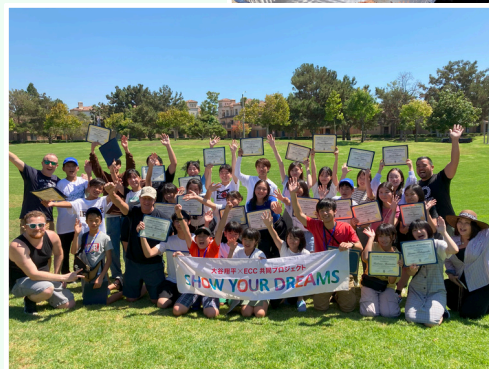
BBQ Party!では修了証が渡されます