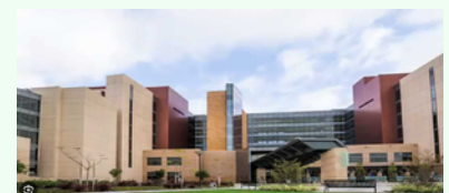
University of California Irvine